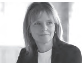
Eva Schalling Emil A. Schalling KG