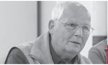
Werner Gläser Kunsth Handwerk Gläser